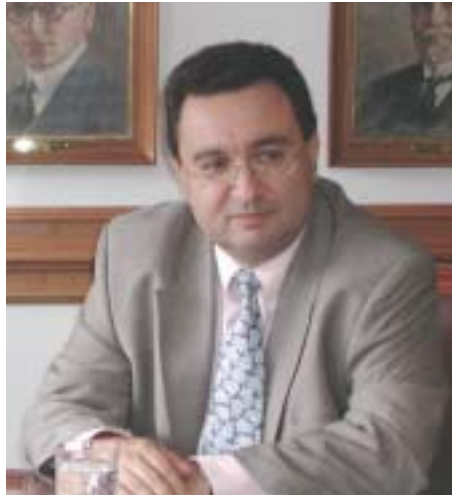
Carlos Arturo Gómez Pavajeau Viceprocurador General de la Nación

Los constitucionalistas colombianos distinguen dentro de las funciones del Procurador General de la Nación aquella referida a la defensa de la sociedad. No obstante, revisados los