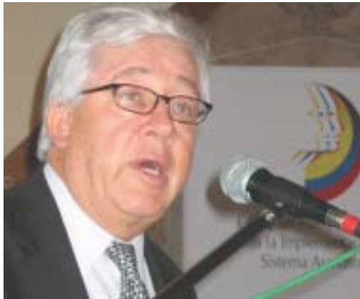
Luis Camilo Osorio, Fiscal General de la Nación

Las disciplinas que explican el mejor modo de ejercer la justicia penal estaban reclamando una adecuación de nuestras vetustas instituciones procesales a la racionalidad de un sistema judicial, en el cual convergen el respeto a los derechos fundamentales, con soporte en métodos y técnicas que estimulan la confiabilidad en los actos eficaces de investigación y juzgamiento. El respeto por la dignidad humana logra, en la nueva normatividad penal, su verdadero esplendor, con principios rectores del Código de Procedimiento Penal, en los que tiene asiento la doctrina y la jurisprudencia, nacionales y extranjeras, y se expande realizando una efectiva y práctica vocación democrática.