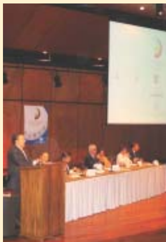
Instalación Comité Seccional Bogotá

ma penal acusatorio basado en el principio de concentración de la prueba en juicio y el método oral, tendencia a la que ya se han sumado países como El Salvador, Honduras, Nicaragua, Guatemala, Ecuador, Chile, Paraguay y la República Dominicana.