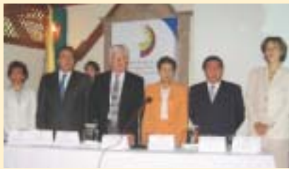
Instalación Comités Seccionales del Eje Cafetero

Con la reciente Sanción Presidencial al Código de Procedimiento Penal Colombia asumirá el importante reto de migrar del esquema mixto actual, a un siste-